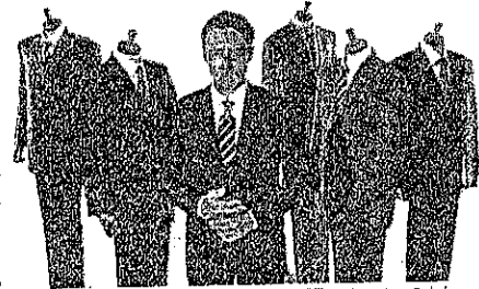
このチャンスにスーツのまとめ買いもいいですね

「男のスタイル大バーゲン」11月4日(水)～10日(火) 2着2万9000円(税込み)のコーナーでは略礼服も展開 大丸京都店